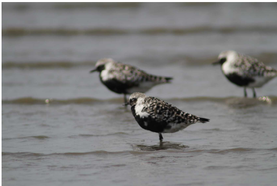
(写真：ダイゼン 大授搦)

すが2001年8月5日の記録を見るとミサゴ、チュウサギ、コサギ、ダイサギ、アオサギ、チュウシャクシギ、ホウロクシギ、ダイシャクシギ、ソリハシシギ、キアシシギ、ウズラシギ、オグロシギ、オオソリハシシギ、トウネン、アオアシシギ、ハマシギ、シロチドリ、ダイゼン、オオメダイチドリ、メダイチドリ、キセキレイ、ホオジロ、ヒバリ、スズメ、セッカ、ムクドリが観察されています。すでに多くの鳥たちが来ていますね。今年も、雨が多いという予想ですが、当日はきっと晴れていると信じています。なお、干拓地には、日陰は一切ありません、帽子や日傘など日焼け対策と飲み物をお忘れ無く。繁殖を終え、南に向かう旅のひとつを干潟で過ごす鳥たちに会いに大授搦を訪れてみませんか。