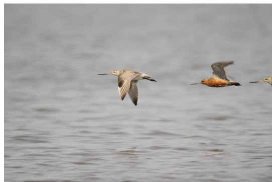
(写真：オオソリハシシギ 大授搦)