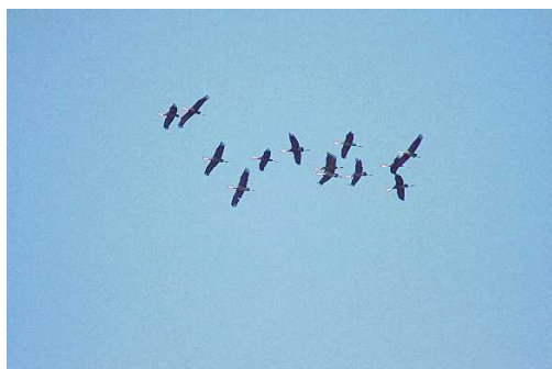
ナベヅル 石岳展望台にて