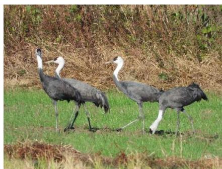
ナベヅル 佐世保市新田町