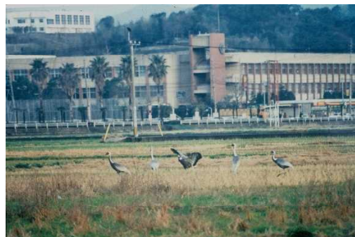
マナヅル 佐世保市新田町 県立大学前